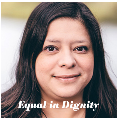
Equal in Dignity